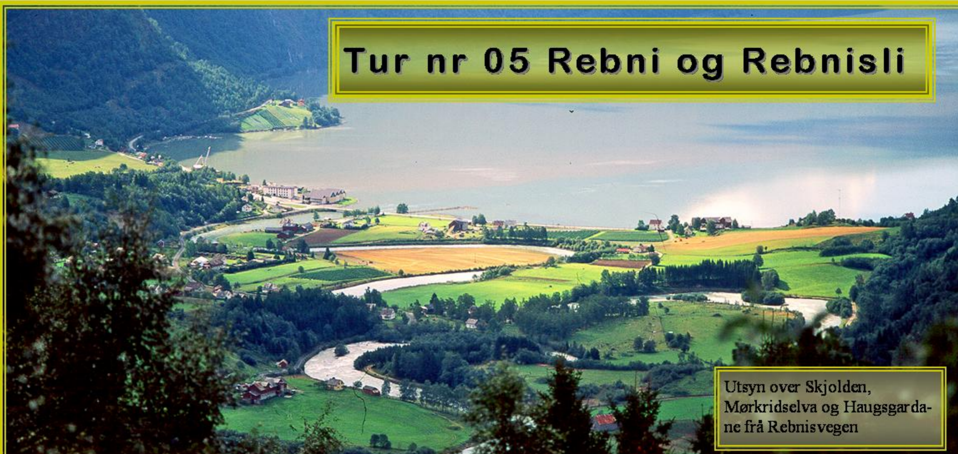
Utsyn over Skjolden, Mørkridselva og Haugsgardane frå Rebnisvegen

Utsiktstur forbi høgdegardane Flaten, Skåri og Rebni til stølen Rebnisli. Flott utsyn mot Skjolden, Lusterfjorden og delar av Mørkridsdalen. Traktorveg til Rebni. Sti vidare.